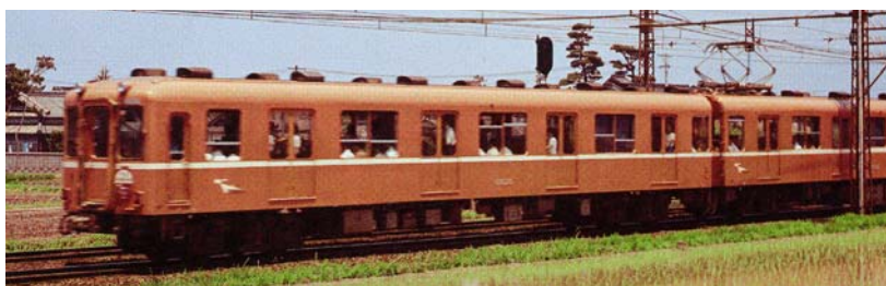
かつて吉野線と南大阪線で活躍したラビットカー

かつて吉野線と南大阪線で活躍した「ラビットカー」のリバイバル塗装車が復活します！高加速、高減速で駅間を走行する姿がウサギに例えられた鉄路の名優に、ご乗車いただけます。キャンペーンのオープニングにあわせ、9月8日(土)旅行商品「吉野線開業100周年記念列車」で運行開始します。この車両を使用した商品として、11月4日(日)「歌声列車」などを予定しています。通常は、南大阪線・吉野線などで定期列車としても運行します。