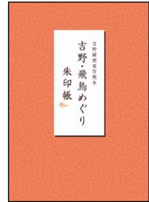
吉野線開業百周年 吉野・飛鳥めぐり朱印帳

ご朱印をいただける主な社寺： 金峯山寺、如意輪寺、吉水神社、櫻本坊、竹林院、 東南院、喜蔵院、吉野神宮、岡寺、橘寺、飛鳥寺、 檀原神宮、久米寺、おふさ観音、壺阪寺