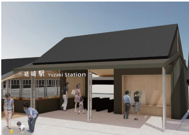
結崎駅改札口（イメージ）