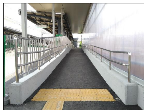
橿原神宮前方面のスロープ