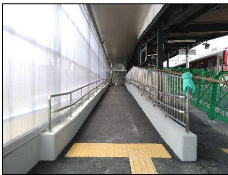
大和西大寺方面のスロープ