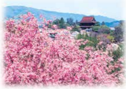
世界遺產 紀伊山地的 靈地與參拜道