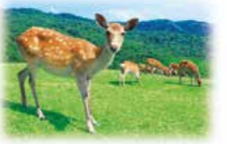
世界遺產 古奈良的 歷史遺蹟