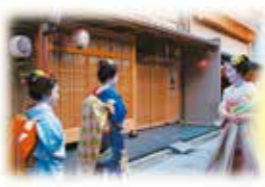
世界遺產 古京都遺址