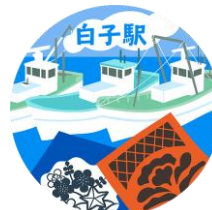
デジタルスタンプ (イメージ)