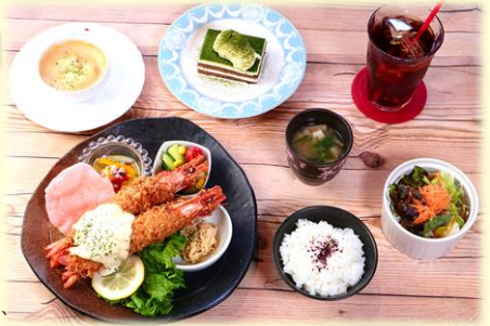
昼食にご用意! 「有頭海老フライランチ」