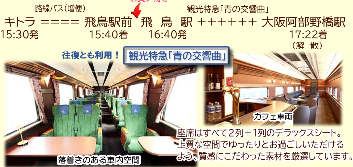
往復とも利用! 観光特急「青の交響曲」

高松塚古墳から見つかった「海獣葡萄鏡」をミニチュアサイズで再現します! (合金を溶かして型に流し入れる鑄造作業を体験!)