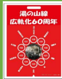
系統板マグネット(イメージ) (湯の山線広軌化60周年)

※1会計につき、各種2個まで購入が可能です。 ※3月23日は12:50~13:30の間湯の山温泉駅で発売いたします。以降は四日市駅営業所で発売します。