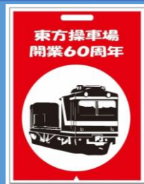
系統板マグネット(イメージ) (東方操車場開業60周年)

※1会計につき、各種2個まで購入が可能です。 ※3月23日は10:00~11:00の間、桑名駅(東方)撮影会会場で発売いたします。 以降は桑名駅駅窓口で発売いたします。