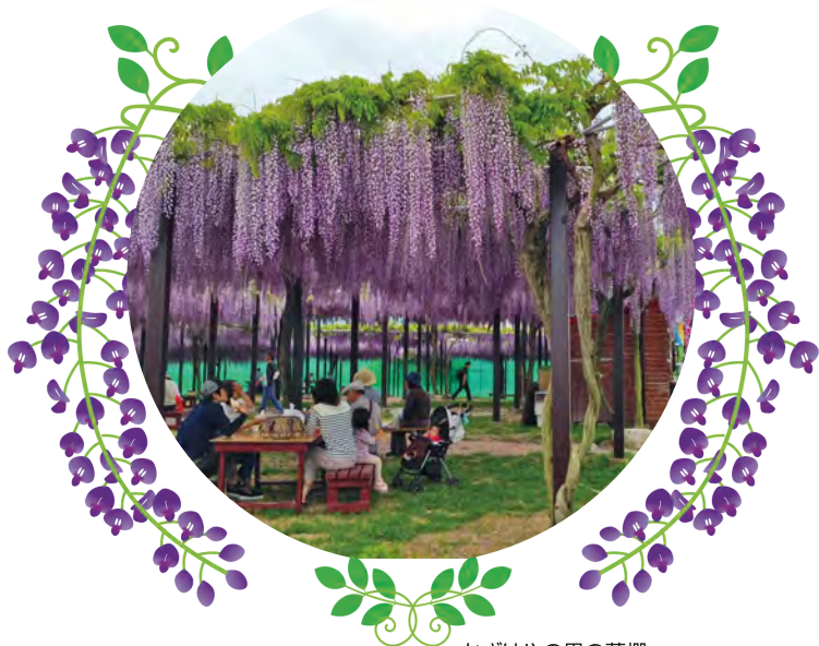
かざはやの里の藤棚