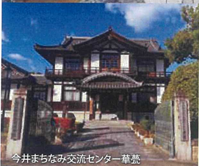
今井まちなみ交流センター華菴