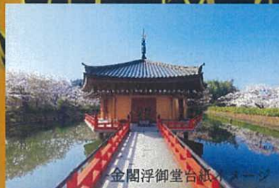
金閣浮御堂台紙イメージ