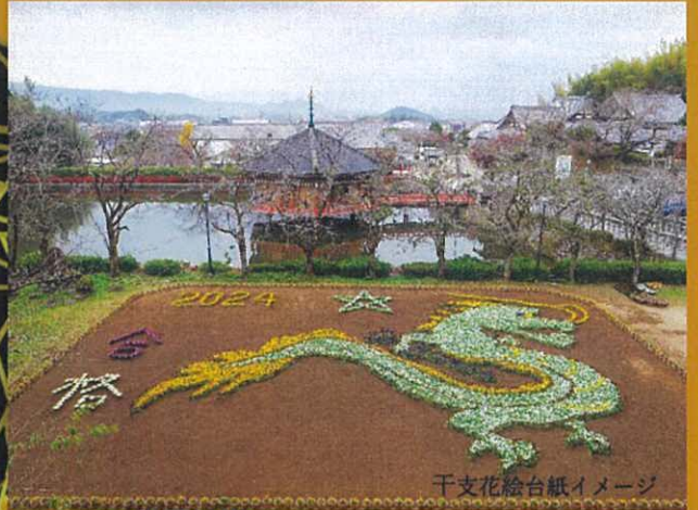
千支花絵台紙イメージ