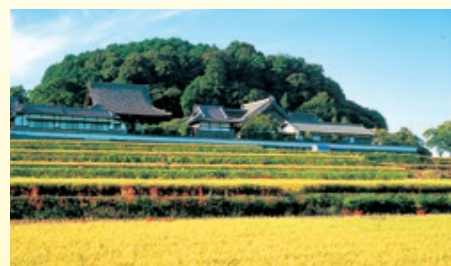
橘寺 聖徳太子生誕の地と伝えられ、太子建立の七ヶ寺のひとつ。