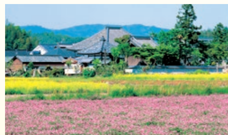
飛鳥寺 日本最初の本格的仏教寺院。本尊飛鳥大仏は日本最古の仏像とされる。