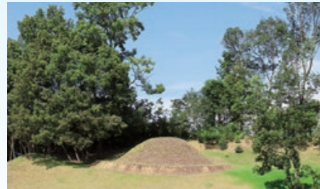
キトラ古墳 石室内の天文図や四神の壁画が有名。2016年9月にキトラ古墳壁画体験館「四神の館」がオープンした。