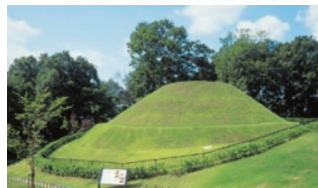
高松塚古墳 藤原京期の古墳。日本で初めて発見された極彩色の壁画が有名。