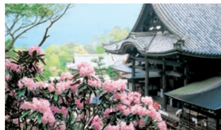
岡寺 石楠花(ジャクナゲ)などの名所。本尊は4.85mにも及び如意輪観音坐像。