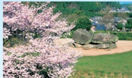
石舞台古墳 7世紀に建造。総重量約2,300tで、蘇我馬子の墓という説が有力。