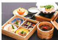
お伊勢さんの味力“てこね”

「伊勢なでしこ」が神宮をご案内の上「お伊勢さんの味力“てこね”」の昼食がつく「Aプラン」と、下車後に自由行動となる「Bプラン」をご用意。