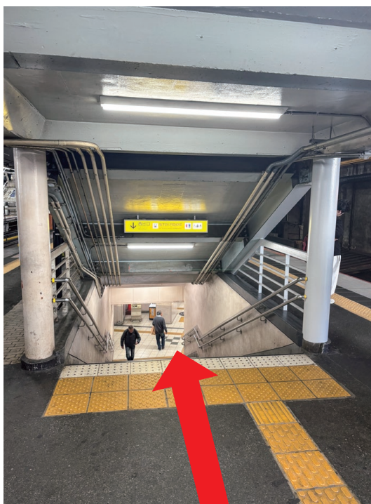
▼1・2番のりば西改札口(★)への階段