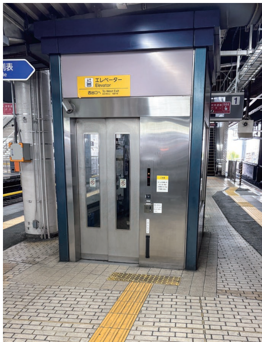
1・2番のりばエレベーター(●)